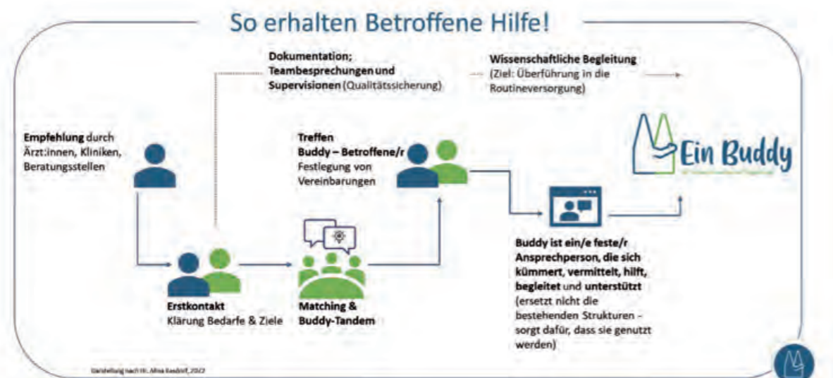
Abb. 1: Von der Kontaktaufnahme bis zur Vermittlung eines Buddies

Ehren- und hauptamtliche Buddies arbeiten immer zusammen im Tandem. Gemeinsam sind sie zentrale Ansprechpersonen für Betroffene und Zugehörige, suchen diese regelmäßig auf, haben Zeit und hören zu, sind krisenfest und frühzeitig ansprechbar, „bevor es brennt“. Wie sich der Prozess von der Kontaktaufnahme bis zur Vermittlung eines Buddies gestalten kann, zeigt Abbildung 1.