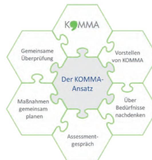
Der KOMMA-Ansatz wurde in England entwickelt (Carer Support Needs Assessment Tool, CSNAT) und für den Einsatz im deutschsprachigen Raum übersetzt.

Das Akronym steht für KOM munikation Mit Angehörigen. Bei KOMMA geht es darum, Angehörigen mehr Gehör zu schenken und durch eine systematische Erfassung ein besseres Verständnis ihrer Bedürfnisse zu gewinnen. Die Selbsteinschätzung Angehöriger bzgl. ihrer eigenen Bedürfnisse mittels eines Einschätzungsbogens ist ein elementarer Baustein. In einem fünfschrittigen strukturierten Prozess werden Unterstützungswünsche erfasst, Ressourcen mobilisierende und unterstützende Gespräche geführt, Maßnahmen zur Bedürfniserfüllung erarbeitet und im Verlauf die Ergebnisse immer wieder überprüft.