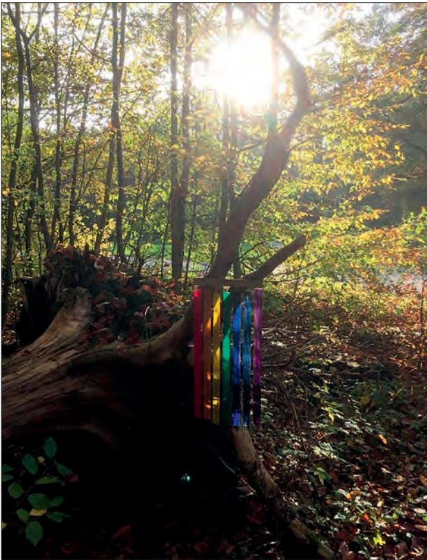
Station: Entwurzelter Baum

Im Folgenden werden einzelne Stationen beschrieben, um einen ersten Eindruck davon zu gewinnen, mit welcher Symbolik die Gefühle und das Erleben von trauernden Menschen dargestellt werden.