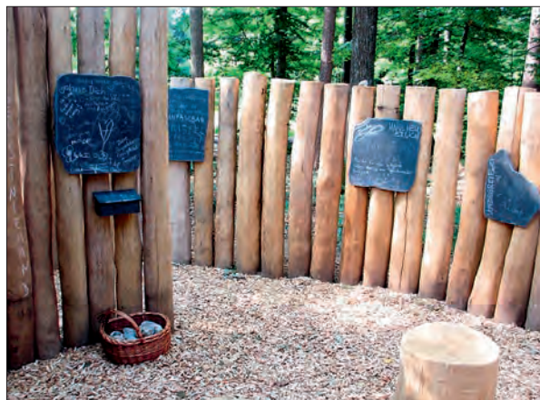
Station: Raum für mICH

Manchmal brauchen Trauernde Abstand. Sie möchten sich zurückziehen, und sich in den hintersten Winkel eines Schneckenhauses verkriechen. Diese Möglichkeit bietet der sehr zentral gelegene „Raum für mICH.“ Zwar umschließen hohe Palisaden den Raum, der in Schneckenform angelegt ist. Gleichzeitig gewähren die Palisaden schmale Lichtblicke nach außen. Das Wort Ich ist mit Großbuchstaben geschrieben. ICH brauche Orte der Trauer, in denen ICH versuchen kann, mich zu spüren.