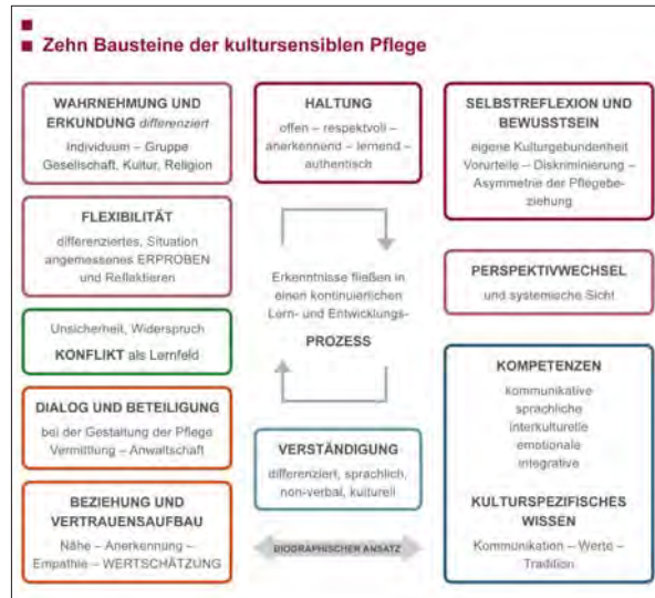
Abb.1: Zehn Bausteine der kultursensiblen Pflege (Zanier, 2015)

All diese Überschriften könnten Bestandteile eines Befähigungskurses für ehrenamtliche Hospizmitarbeiterinnen und -mitarbeiter sein und machen deutlich, dass der Begriff der Kultursensibilität ersetzt werden kann durch den Begriff der „zwischenmenschlichen Resonanz“.