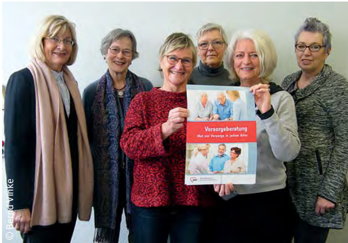
Team der Vorsorgeberaterinnen