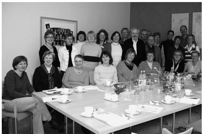
Regionalgruppe des Kreises Coesfeld und der Stadt Selm

Informationsteil zu aktuellen Themen, zu dem gegebenenfalls Referenten verpflichtet werden.