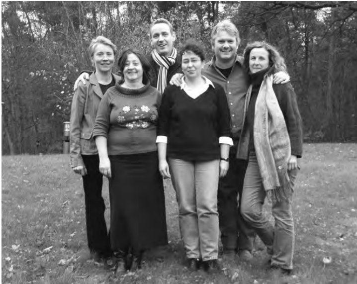
... nach Redaktionsschluss

D er Arbeitskreis psychosozialer Fachkräfte in NRW wurde 1994 gegründet. Er versteht sich seitdem als Fachforum für die Vielfältigkeit der psychosozialen und sozialrechtlichen Arbeitsschwerpunkte in der Beratung und Begleitung sterbender Menschen, ihrer (pflegenden) Zugehörigen sowie der nachgehenden Betreuung trauernder Menschen.