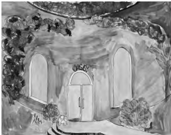
Künstlerische Verarbeitung von Sterben und Trauern

Hauptanliegen der Gruppe war, wie man trotz allgegenwärtiger Sparzwänge und erhöhtem Zeitdruck „palliativ arbeiten“ könne. Einig war man sich über den hohen Stellenwert vom Austausch unterschiedlicher Berufsgruppen. Kommunikation und interdisziplinäre Arbeitsteilung bei existenziellen Entscheidungen müssten aber geschult werden. Manche Professionelle hätten aber auch kein