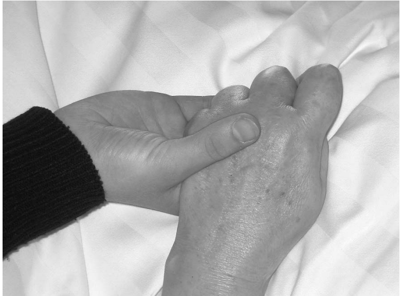
Die Hand einer Dame im Wachkoma. In diesem speziellen Fall ist es so, dass die Dame über ihre Hand kommuniziert: Mit Drücken der Hand signalisiert sie ein JA, nicht drücken bei entsprechender Fragestellung meint NEIN.

Einen sterbenden Menschen im Wachkoma zu begleiten, unterscheidet sich nicht grundsätzlich von der Begleitung eines anderen sterbenden Menschen. Da die Formen der Kommunikation mit Menschen im Wachkoma im nonverbalen Bereich vielfältiger sind und häufig jahrelange diesbezügliche Erfahrungen vorliegen, sind die Betreuer bei einem Sterbeprozess in diesem Bereich besser vorbereitet. Den Menschen leiblich anzusprechen, um ihn zu erreichen und von ihm Antwort zu bekommen, das ist ein bereits erprobter Weg der Kontaktauf-