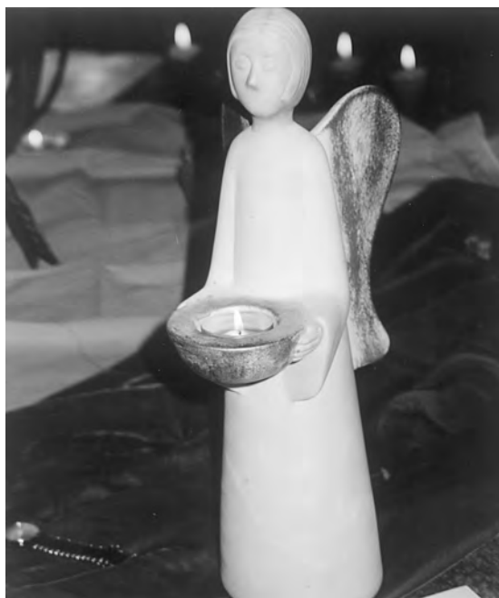
Engel: Hüter des Lichtes für die verstorbenen Kinder (Trauerseminar 09. – 11.01.04)

Täglich stellen Kinderhospize sich der Herausforderung, mit den erkrankten Kindern im Rahmen einer ganzheitlichen Sterbebegleitung in einen – oft nonverbalen – Dialog