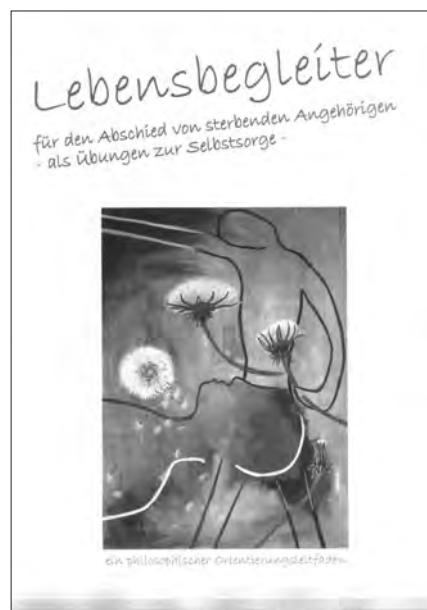
Ratgeber für den Abschied von sterbenden Angehörigen